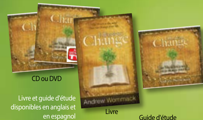
CD ou DVD Livre et guide d'étude disponibles en anglais et en espagnol