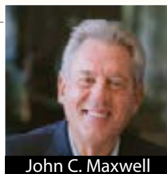
John C. Maxwell

En tant que chef d'entreprise chrétien, êtes-vous en train d'exprimer votre plein potentiel ? De nombreux propriétaires d'entreprises et entrepreneurs commencent leur parcours avec une vision ou un rêve, mais ce rêve doit être cultivé. Dieu désire vous voir réussir dans tous les domaines de votre vie, y compris dans le domaine du business .